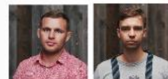
Архитектор Евгений Загородный Дизайнер Олег Панушкин Работы на Дону

Если природа и погода к этому располагают, то сделать при помощи сплошного остекления вид за окном превосходным и непрерывно меняющимся в зависимости от сезона и времени суток фоном для огромной общественной зоны проектируемого дома – очень грамотный и правильный ход со стороны архитекторов. Кроме хорошего вида этому достаточно глубокому и обширному помещению досталась еще и масса дневного света. Но архитекторы этого проекта на достигнутом не остановились и усложнили задачу, они не только центральной осью панорамы сделали большой и красивый камин, чья топка обложена кирпичом, а дрова в нишах по бокам настоящие, они еще смогли установить его так, что он работает на две стороны: и на интерьер, и на улицу, таким образом являясь и осью между ними. А если учесть, что перед домом площадка